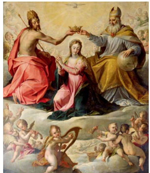
Die Krönung Mariae: ca. 1596, Augsburg, Basilika St. Ulrich und Aphra, Abbildung nach Katalog.