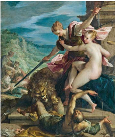
Allegorie der Gerechtigkeit: 1598, München, Alte Pinakothek, Abbildung nach Katalog.

Allerdings nicht lange: Der Chef-Logistiker des Mammutprojekts ist wohl erst wieder ganz entspannt, wenn er die Ausstellungseröffnung erfolgreich hinter sich gebracht hat. Dann geht er im Suermondt-Ludwig-Museum auf seine ganz persönliche Entdeckungsreise mit Hans von Aachen.